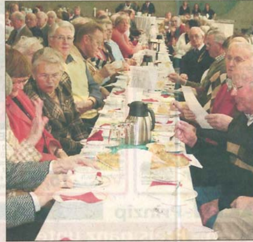
Erst die Stärkung, dann das Vergnügen: Das Publikum ließ es sich am Samstag in Neuenkirchen rundum gut gehen.