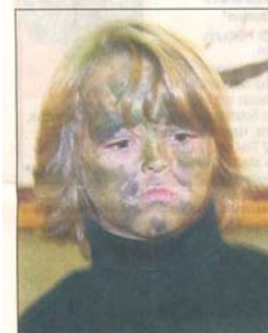
Konzentriert ging es beim CNN-Kinderballett zu.