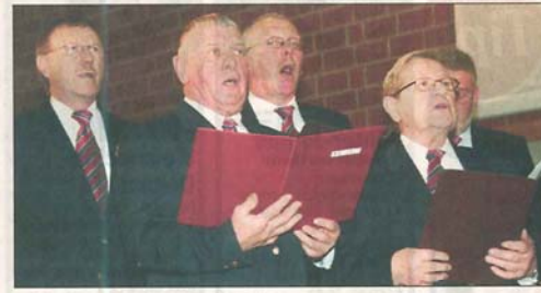
Ausgezeichnet bei Stimme präsentierten sich die Sänger des 1873 gegründeten Vördener Männergesangsvereins bei ihrem Auftritt in der Sporthalle der Haupt- und Realschule.