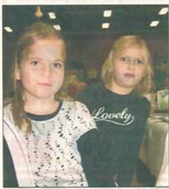
Gute Laune hatten ob des vielfältigen Programmes auch die jüngsten Zuschauer.