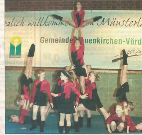
Akrobatik vom Feinsten: Die jungen Akrobatinnen des TV Vörden begeisterten mit sehenswerten Übungen.