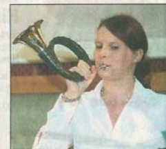
Den guten Ton trafen die Jagdhornbläser Neuenkirchen.