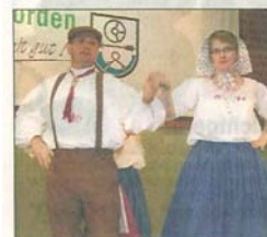
Perfekt war der Auftritt der Burskupper Danzlüe.