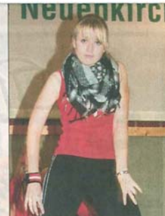
Moderne Tänze zeigten Schülerinnen der Musikschule.