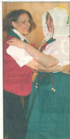
Ganz schön flott tanzten die flotten Landbienen.